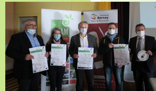
Les élus ayant signé la Charte Mon Restaurant Ecoresponsable

Ce livret a été réalisé pour partager les bonnes idées et les outils mis en place dans les cantines accompagnées, aux élus et aux équipes de cuisines collectives qui souhaiteraient lancer des démarches similaires dans leurs cantines.